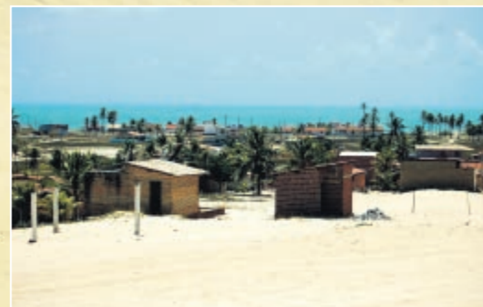
En tur langs kysten nordpå fra Búzios går gennem Ponta Negra og Natal. Sanddynerne spreder sig langs vejen som et enormt naturreservat. Normalt kører de lave, firhulede langs stranden – men i januar er de hvide sandstrande forbeholdt turister.