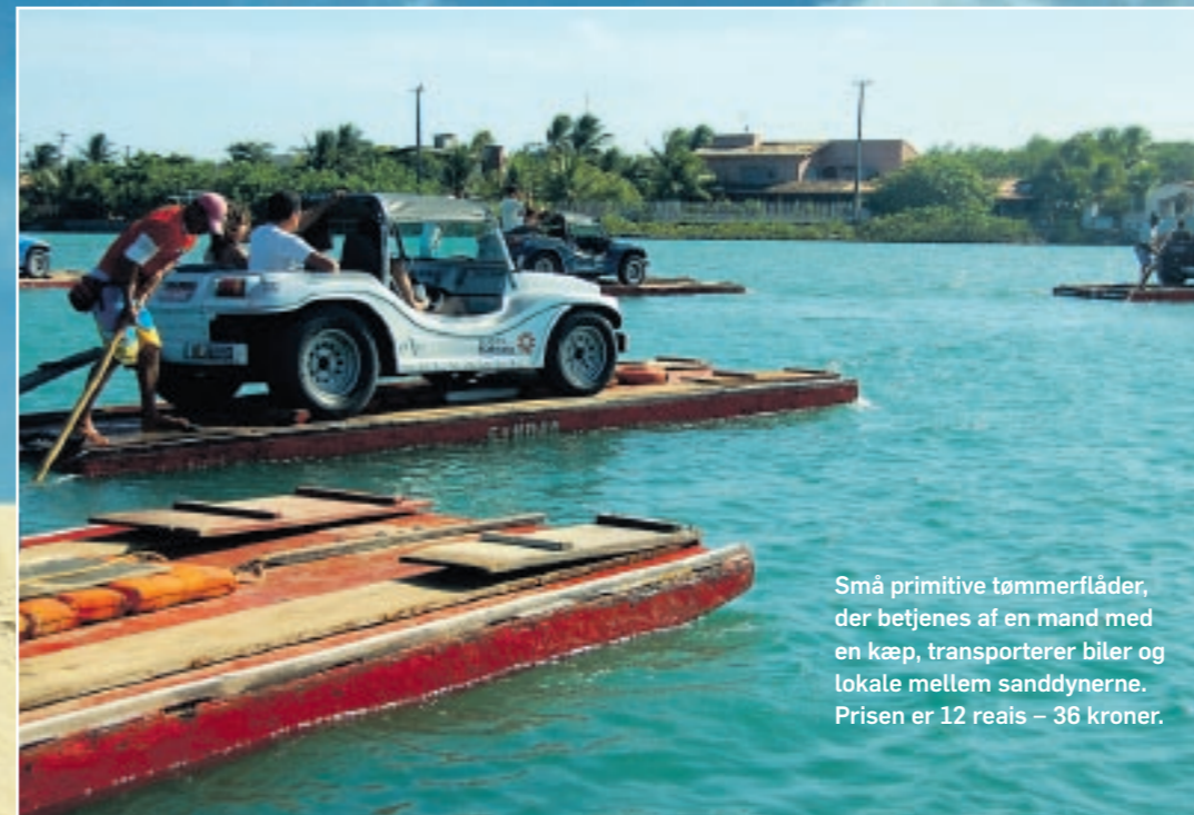
Små primitive tømmerflåder, der betjenes af en mand med en kæp, transporterer biler og lokale mellem sanddynerne. Prisen er 12 reais – 36 kroner.

Med speederen i bund rammer bilen en topfart på omkring 100 kilometer i timen, så det gælder om at holde godt fast på bagsædet af de små beachbuggies.